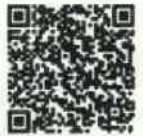
バリアフリー映画会 QRコード